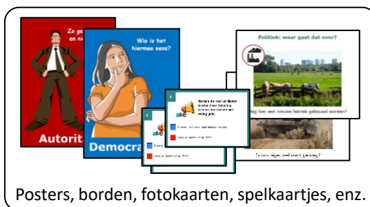
Posters, borden, fotokaarten, spelkaartjes, enz.

Deze worden wel gebruikt maar niet verbruikt; ze gaan na afloop terug in de leskist.